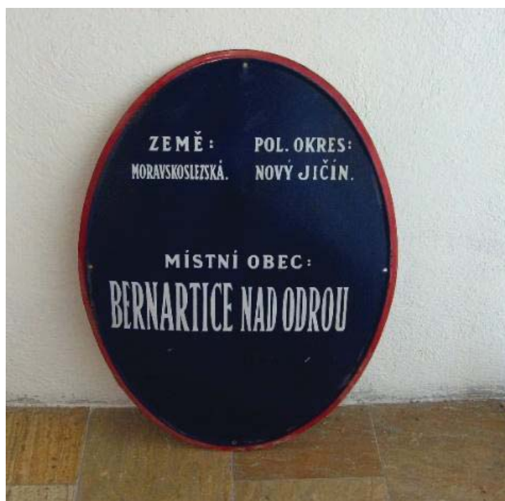
Historická cedule, zůstala v archívu obce