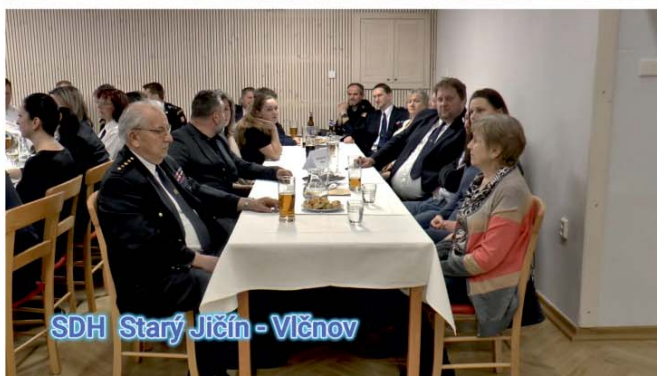
SDH Starý Jičín - Vlčnov