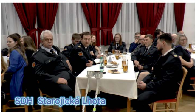
SDH Starojická Lhota