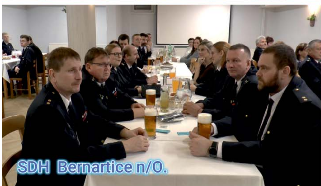
SDH Bernartice n/O.